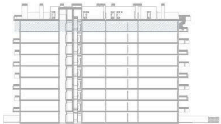
PLAYA DE TORRES (LA VILA JOIOSA)